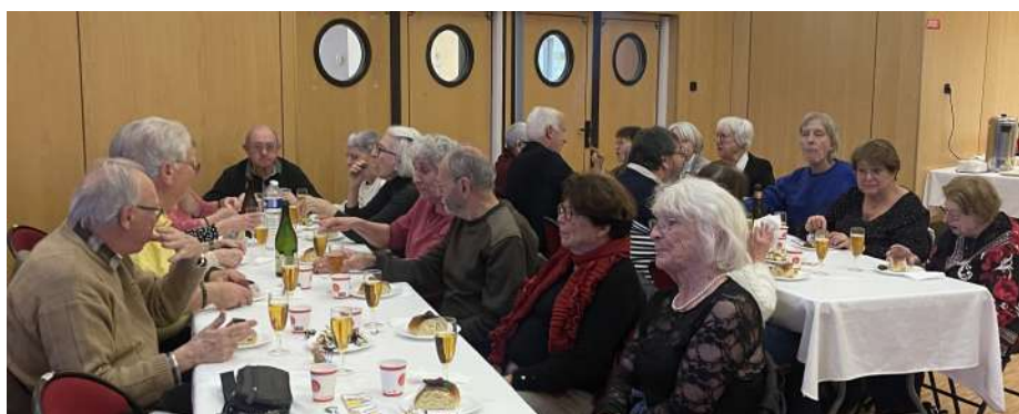
Le Gâteau des Rois du CCAS