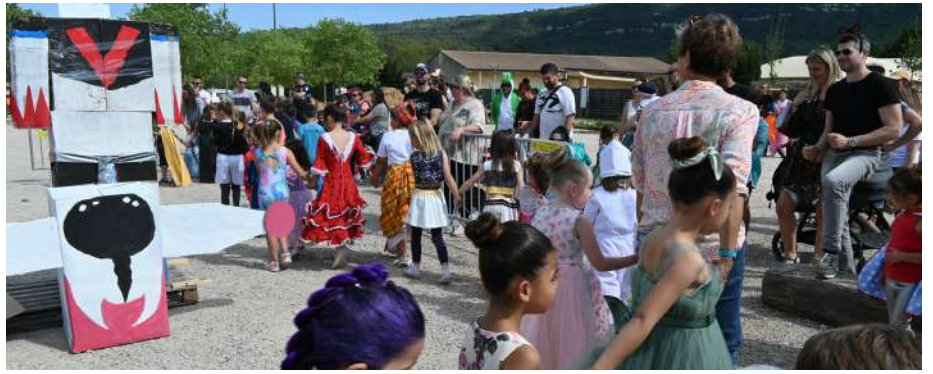
Carnaval Odel Var et Pep's 2026, sur le thème Galaxie