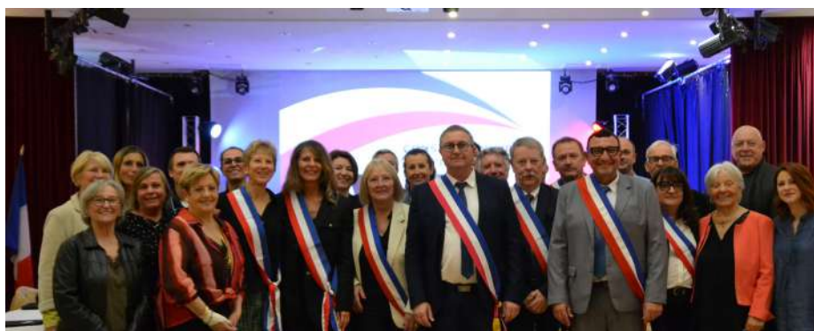
Conseil Municipal d'installation