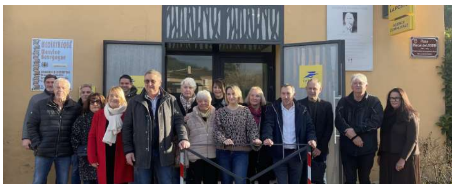
Ouverture de l'Agence Postale Communale