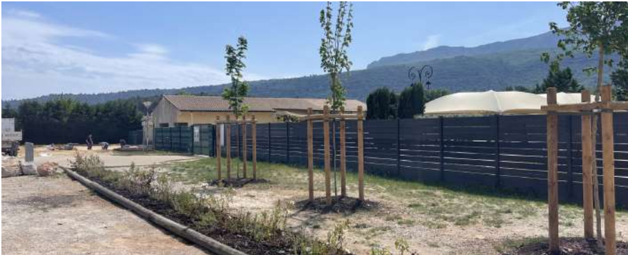
Travaux de végétalisation du parking en terre de la Ferrage