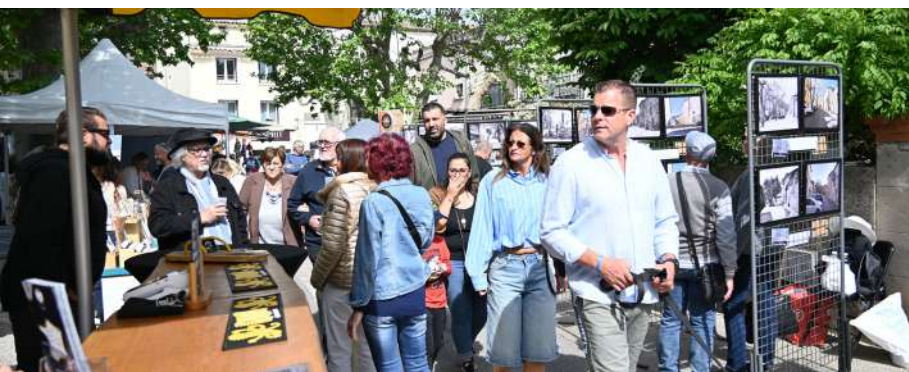
Marché Trésors de Provence