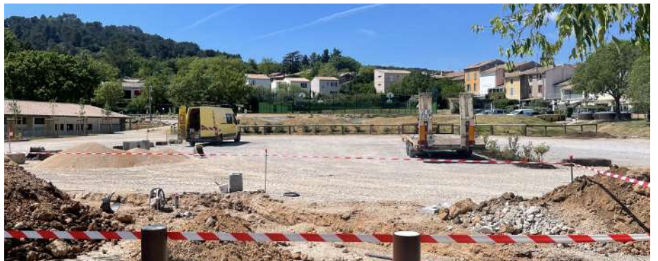
Travaux de raccordement au pluvial