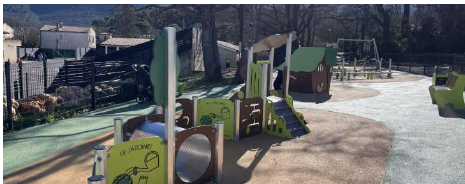
Une aire de jeux entièrement mis en place pour les enfants sur la Ferrage